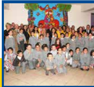
Barış ve Çayyolu Lions'dan Eğitime Dev Katkı...