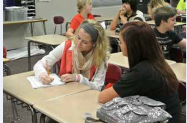
13 Milyondan fazla öğrenci Lions Quest vasıtası ile yaşam becerileri kazanıyorlar.

LCIF fonları ve No Vo Vakfının 100.000 dolarlık başışı Wood County deki üç yıllık programı mümkün hale getirdi. 2012 Ekiminde 280 öğretmen