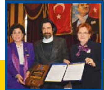
Okan Bayülgen, Melvin Jones Dostluk Ödülü'nü Aldı