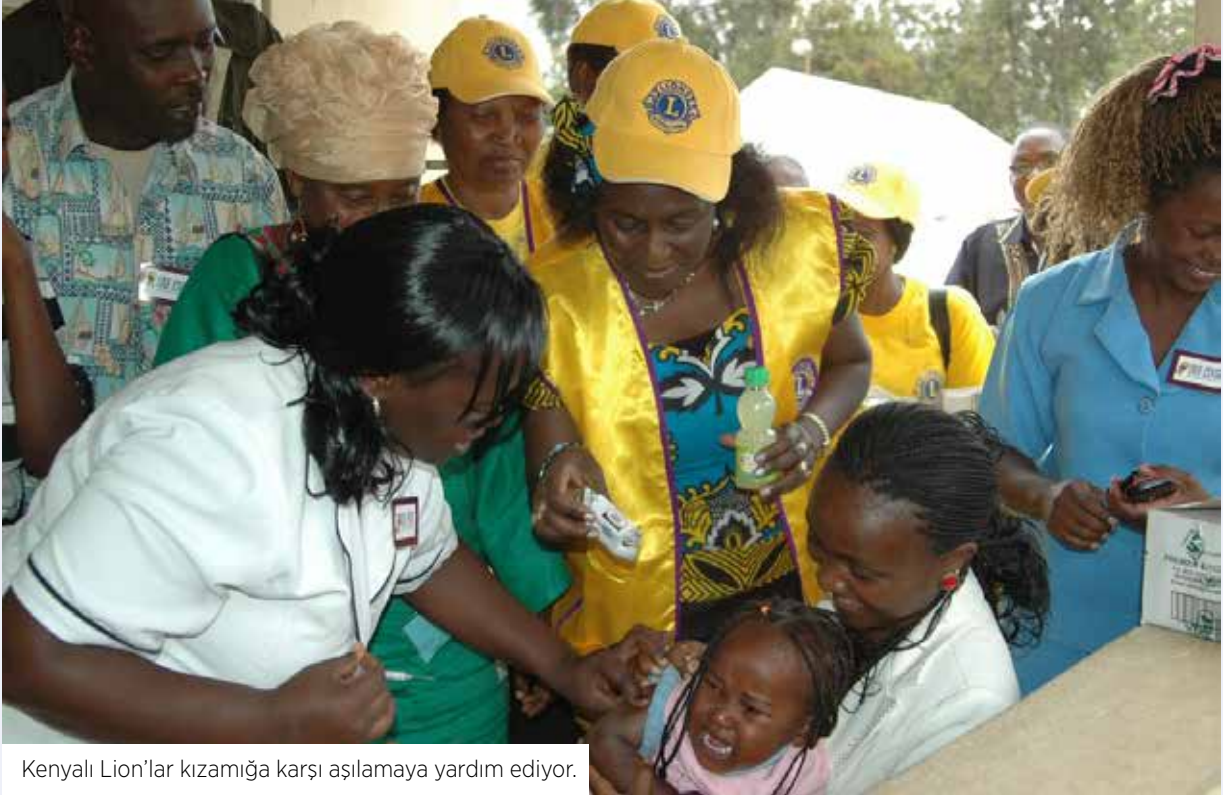
Kenyalı Lion'lar kızamığa karşı aşılama yardım ediyor.

& Melinda Gates Vakfı bunu başarmak için 2011 yılında yola çıktı. set out to do just that in 2011. Gates Vakfı Lion'ları kızamığa karşı 10 Milyon Dolar toplamaları için teşvik etti ancak Lion'lar çok daha fazlasını topladı. İki organizasyon beraber çalışarak 200 Milyon çocuğun aşılama için 15 Milyon Dolar kaynak yarattılar.