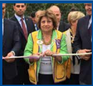
118-T Yönetim Çevresi Federasyonu Sevgi Parkı'nın açılışı